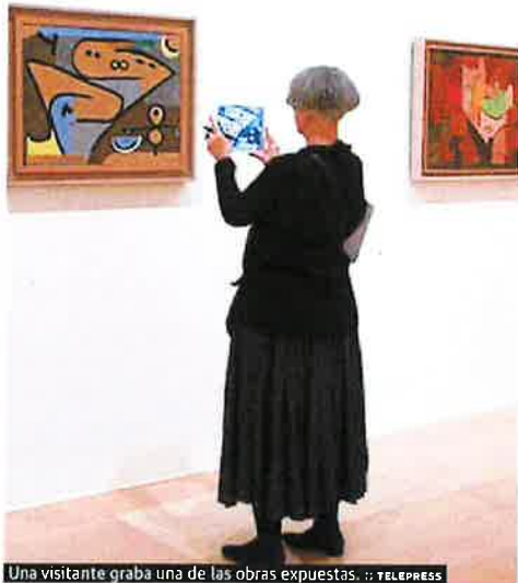
Una visitante graba una de las obras expuestas.

«Vivieron de lo que les daba la mercería, en una casa normal de Berna y en otra que tenían en los Alpes, donde guardaron las obras durante las dos guerras mundiales. Nunca compraron como una inversión para especular luego con ella. Era su modo de vida», relató ayer en el Guggenheim