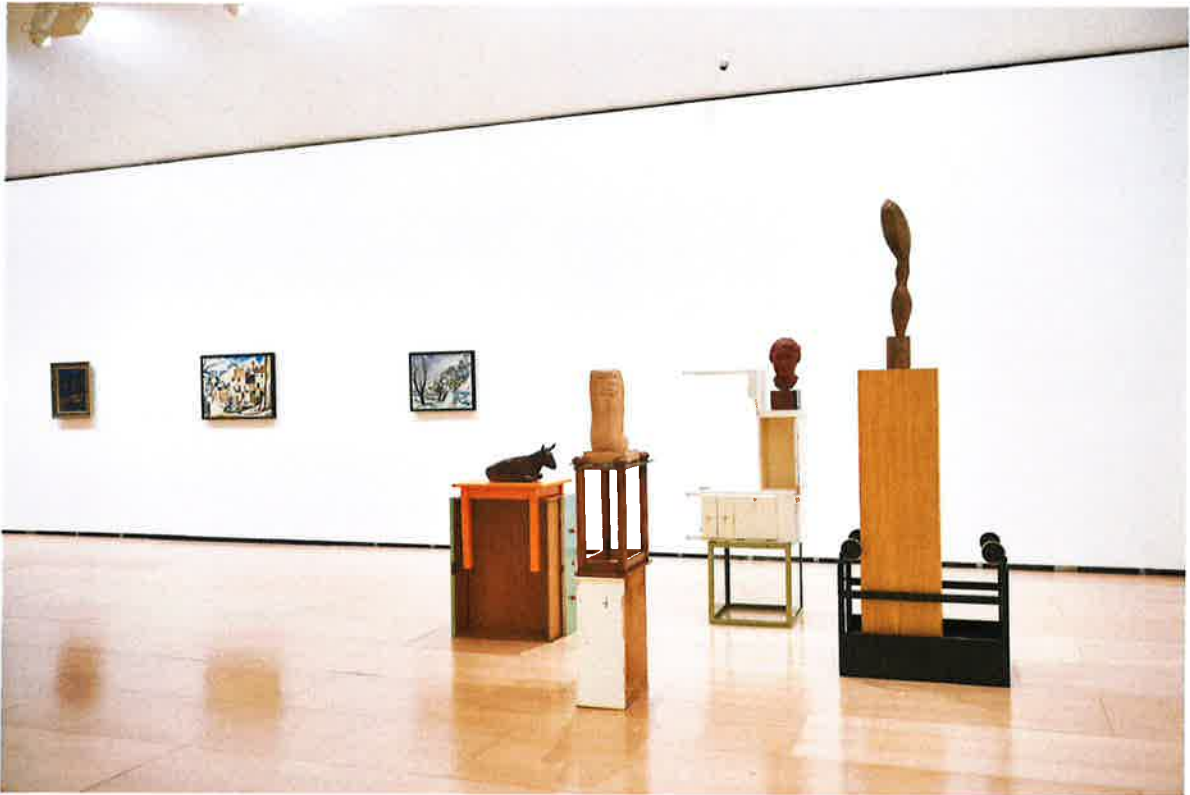
Installationsansicht Guggenheim Museum Bilbao