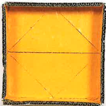
Carlos Bunga, Intersection series #10, 2016, Holz, Karton, Öl, Farbe, Klebstoff, 18 x 18 x 5 cm, Inv. Nr. G 17.003

Im Zentrum von Carlos Bunga's (*1976 in Porto, lebt und arbeitet in Barcelona) künstlerischer Arbeit steht die Beschäftigung mit dem urbanen Raum, mit Architektur aber auch mit den sich permanent verändernden Lebensbedingungen unserer Gesellschaft. Ausgehend von der Malerei hat er seine