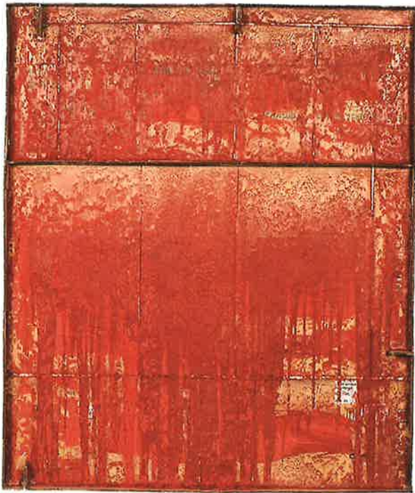
Carlos Bunga, Construcción pictórica #11k, 2016 Holz, Karton, Farbe, Klebstoff, 180 x 150 x 11 cm, Inv. Nr. G 17.004

Die Rupf-Stiftung hat zwei Arbeiten des portugiesischen Künstlers Carlos Bunga (*1976) erworben. Beide Arbeiten waren anlässlich der Ausstellung im Guggenheim Museum zu sehen.