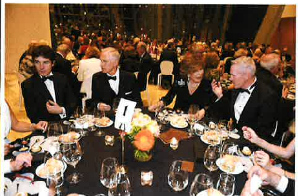
Eröffnungszeremonie /Gala im Guggenheim Museum Bilbao, 11.11.2016