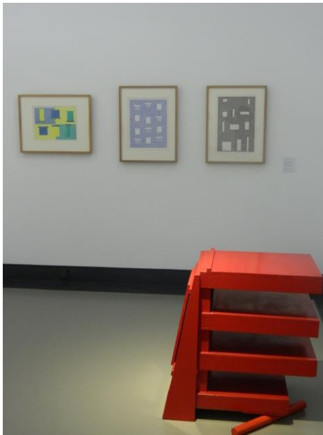
Ausstellungsansicht Museum im Kulturspeicher Würzburg

Das Museum im Kulturspeicher Würzburg konnte als Partner für eine zweite Station der Berner Ausstellung gewonnen werden. Die dort beheimatete Sammlung Konkreter Kunst (Sammlung Ruppert) bildete einen interessanten Rahmen für die Ausstellung der Sammlung Rupf. Ebenfalls mit Schwerpunkt auf den Ankäufen der Rupf-Stiftung konnten dem Publikum über 80 Werke der Berner Stiftung präsentiert werden. Die Ausstellung stiess auf sehr positives Echo.