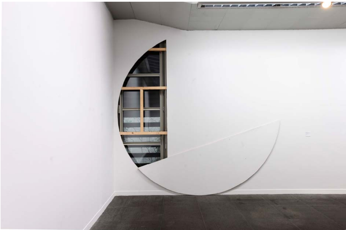
Knut H. Henriksen, a story about the sun and the moon and the chipboard removed to reveal the pearls of water , 2011, Installationsansicht Kunstmuseum Bern.