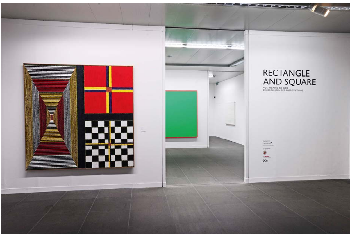
„Rectangle and Square“ – Ausstellungsansicht Kunstmuseum Bern, 2011