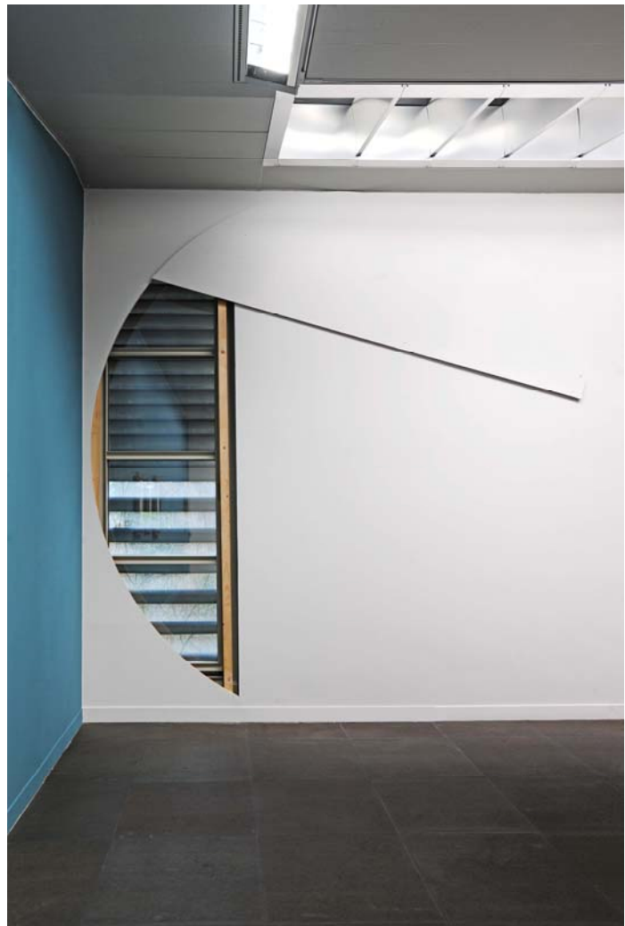
Knut H. Henriksen, a story about the sun and the moon and the chipboard removed to reveal the pearls of water , 2011, Installationsansicht Kunstmuseum Bern.